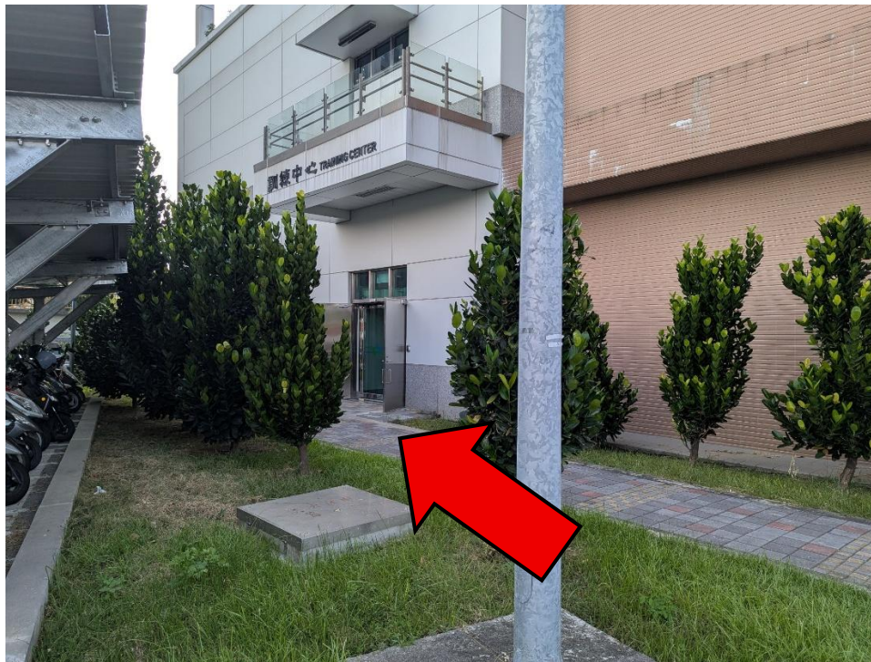
圖 3 會議地點位置入口照片